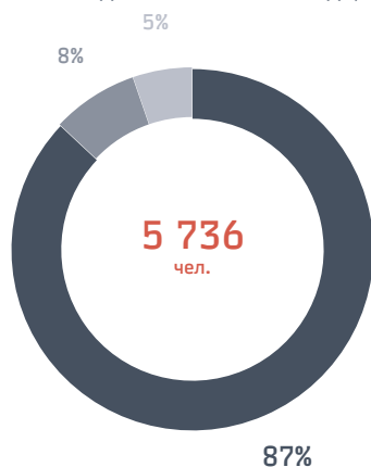
ОБУЧЕНО РУКОВОДИТЕЛЕЙ ГРУППЫ «РЖД», ЧЕЛ.

В 2012 году были отработаны подходы к реализации целевой бизнес-модели взаимодействия Университета с кадровым блоком — «Корпоративный университет как HR-партнер».