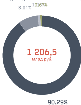
СТРУКТУРА ДОХОДОВ ОТ ПЕРЕВОЗОЧНЫХ ВИДОВ ДЕЯТЕЛЬНОСТИ В 2012 Г.

Необходимо отметить, что за указанный период в ходе реформирования отрасли существенно изменилась структура доходов перевозочных видов деятельности ОАО «РЖД». Для организации работы по выделению обособленных видов бизнеса был разработан и введен приказом Минтранса России (от 31 декабря 2010 г. № 311) Порядок ведения раздельного учета доходов, расходов и финансовых результатов по 10 видам деятельности, тарифным составляющим и укрупненным видам работ. В 2010–2011 гг. произошло реформирование пассажирского комплекса, начали осуществлять хозяйственную деятельность в качестве перевозчиков ОАО «ФПК» в сфере перевозок пассажиров в дальнем следовании и пассажирские пригородные компании по перевозкам пассажиров в пригородном сообщении. Также за период 2010–2012 гг. происходили следующие структурные изменения: 2010–2011 гг. — постепенная передача вагонов в ОАО «Вторая грузовая компания»; 2012 год — начало работы парка привлеченных вагонов ОАО «РЖД».